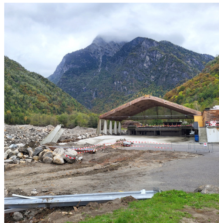
La patinoire a été presque entièrement détruite

du territoire en collaboration avec les entreprises locales. L'aide de la protection civile a été décisive pour remettre en état et rendre à nouveau accessibles les alpages afin de permettre la désalpe à l'approche de l'automne. Nous espérons que les touristes pourront à nouveau parcourir ces sentiers à partir de l'été 2025. Toujours en prévision de l'hiver et de ses chutes de neige, la sécurisation des rivières (restauration des berges) et la protection des zones bâties par des ouvrages de prévention restent une priorité.