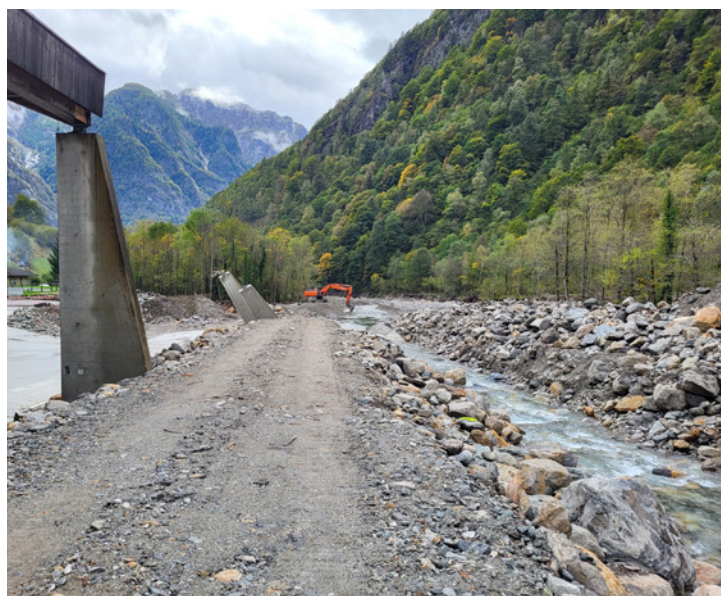
Les rives de la rivière doivent être reconstruites

pal pour garantir l'approvisionnement de toute la population. Le pont effondré de Visletto a été entièrement démolé pour permettre aux ingénieurs et aux experts de travailler à la conception du nouveau pont. En attendant sa reconstruction, la circulation à sens unique passe par le pont militaire construit à proximité.