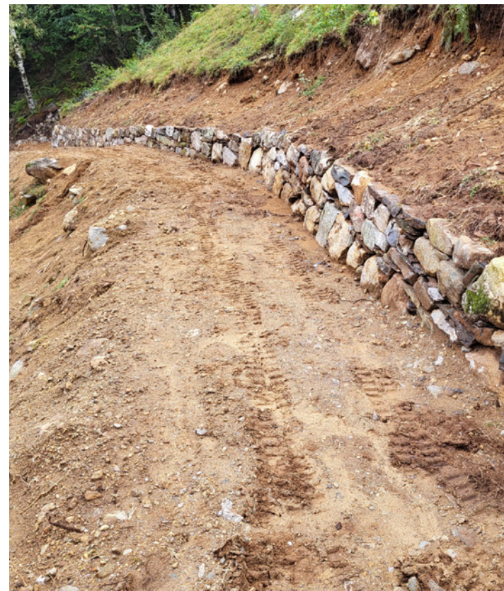
Construction de murs en pierres sèches

À Serenello et Prati di dentro, trois étables, encore utilisées comme abri pour bétail et le stockage du foin, nécessitent des travaux pour continuer à garantir leur utilisation en toute sécurité. Au fil des décades, leurs toitures en pierres plates se sont détériorées et nécessitent une réfection. Il est nécessaire de réparer les murs de l'un de ces bâtiments ainsi que la charpente et les planchers endommagés par les infiltrations provenant du toit.