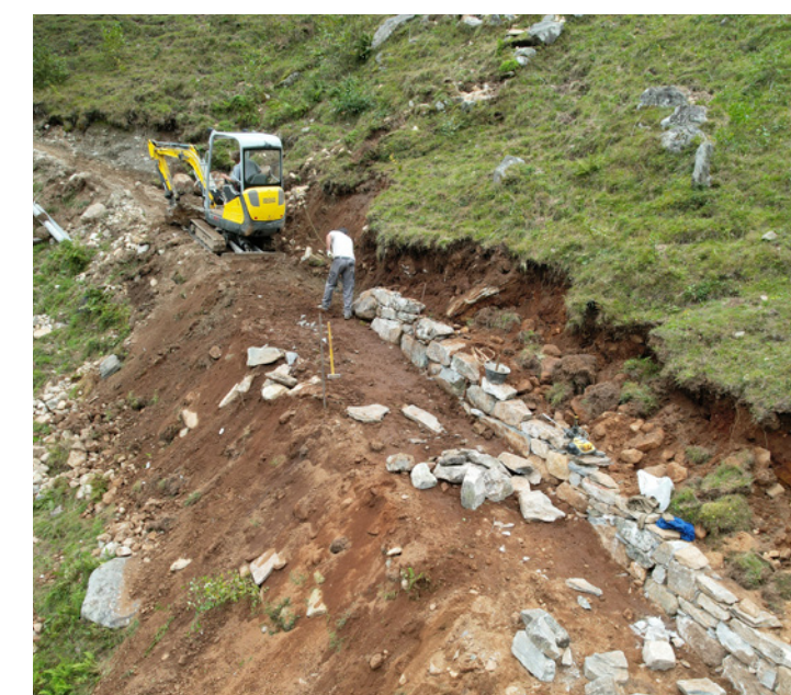
Un tour de force sur terrain accidenté