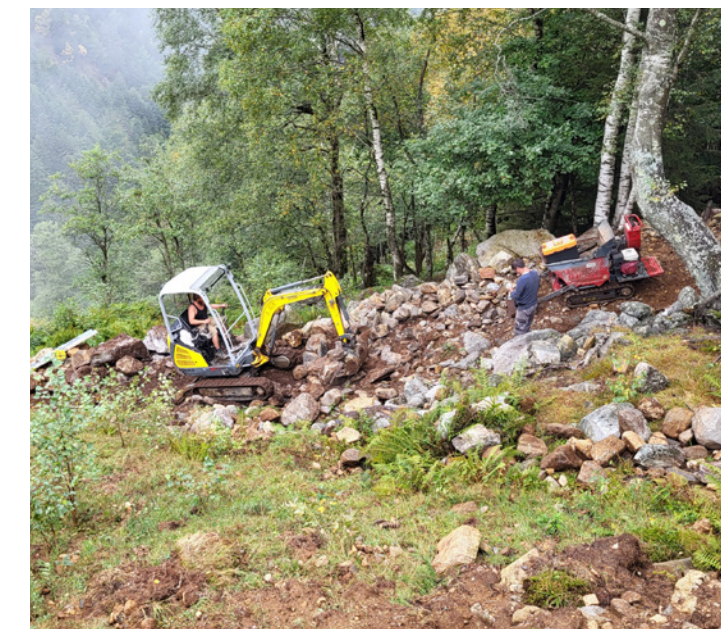
Il y a encore beaucoup à faire

Ces bâtiments sont situés en trois points dans le prolongement de la zone du projet. Une restauration conservatrice est prévue pour la cascina de Corte di Fondo. Son objectif est de créer un refuge rustique dans le style du début du XXe siècle. La toiture en pierres plates doit être refaite pour éviter que les infiltrations ne causent des dommages importants à la structure porteuse.