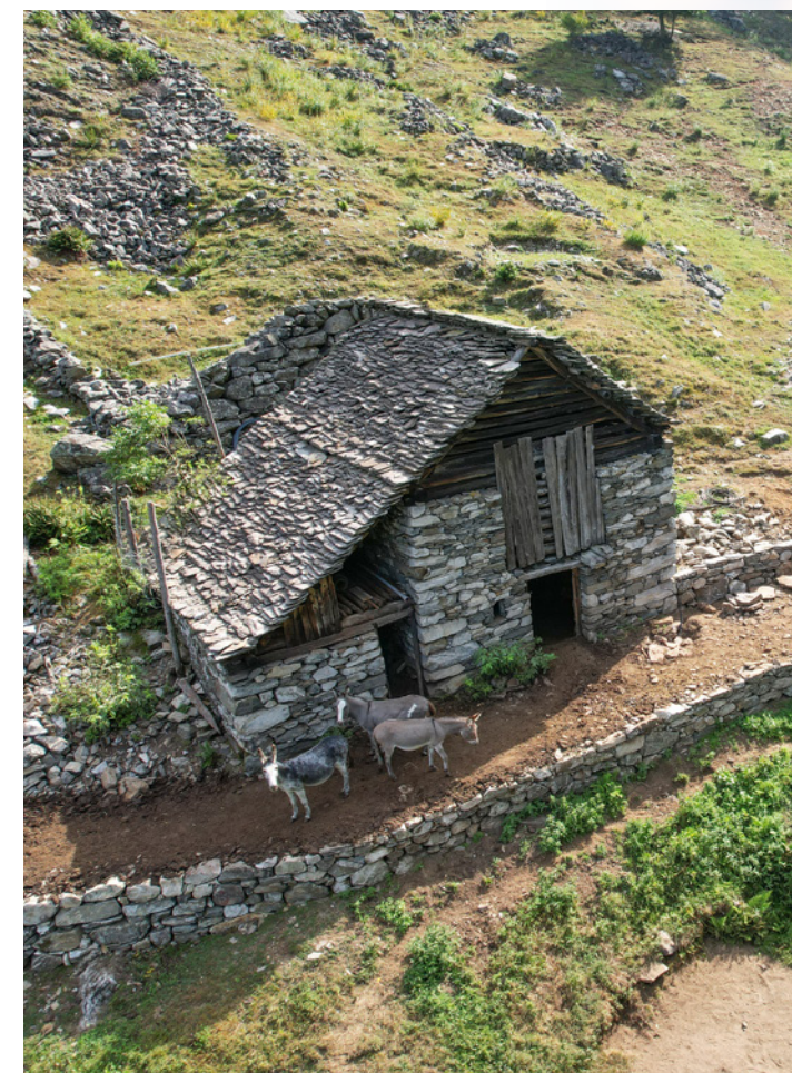
La cascina est à rénover

Pendant que notre vallée se remet des conséquences des intempéries, nous nous apprêtons à poursuivre et, si possible, à terminer les projets en cours. Même si cela n'est pas toujours possible, car une bonne partie des entreprises locales sont engagées dans des travaux de réparation d'urgence. Contraints de nous adapter aux travaux de reconstruction, nous avons vérifié avec les responsables de projet les activités réalisables sans entraver les travaux de réparation, l'objectif étant plutôt de soutenir la reprise économique de la région. Cela implique de revoir la planification, de reporter les activités en lien avec les entreprises de construction et éventuellement d'anticiper les travaux sylvicoles. Rappelons que la construction de murs en pierres sèches ou la pose de toitures en pierres plates nécessitent des connaissances techniques que ne possèdent pas toutes les entreprises de construction, mais dont sont spécialistes celles avec lesquelles nous collaborons depuis des années.