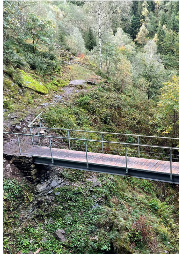
Pont de transition

Le projet entend aussi garantir l'accès à l'eau pour ces constructions. Par conséquent, des conduites et des fontaines seront posées pour assurer l'approvisionnement en eau potable au bétail et aux personnes.