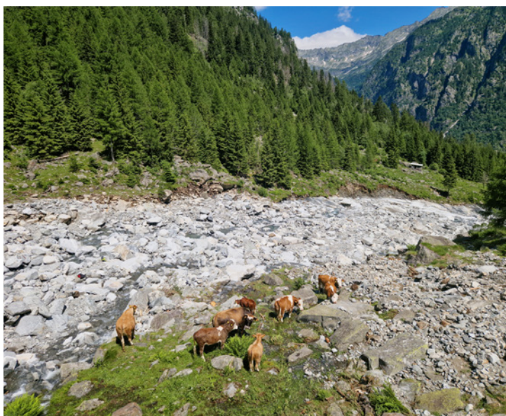
Le pâturage est couvert d'un grand glissement de terrain

Le mauvais temps qui s'est abattu sur notre vallée fin juin et le territoire défiguré qu'il nous a laissé nous ont fait réfléchir. Quelle valeur a notre travail de revalorisation du paysage et de réhabilitation des pâturages et des zones boisées? Est-ce juste un caprice pour faire revivre les ouvrages construits par nos ancêtres? Ou bien est-ce qu'un terrain régulièrement entretenu peut contribuer à limiter les dégâts en cas de fortes pluies ou de grosses chutes de neige? Sans rien enlever au caractère exceptionnel de l'événement survenu fin juin, l'expérience nous enseigne que prendre soin du territoire améliore son adaptabilité face à des situations imprévisibles.